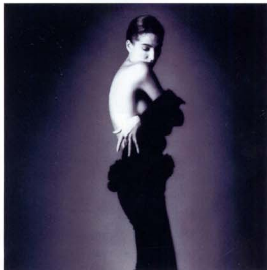
東京都写真美術館 ジャンル・シーフ写真展