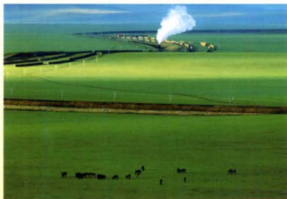
コニカミノルタプラザ 福田伸吉写真展「草原の鉄路」