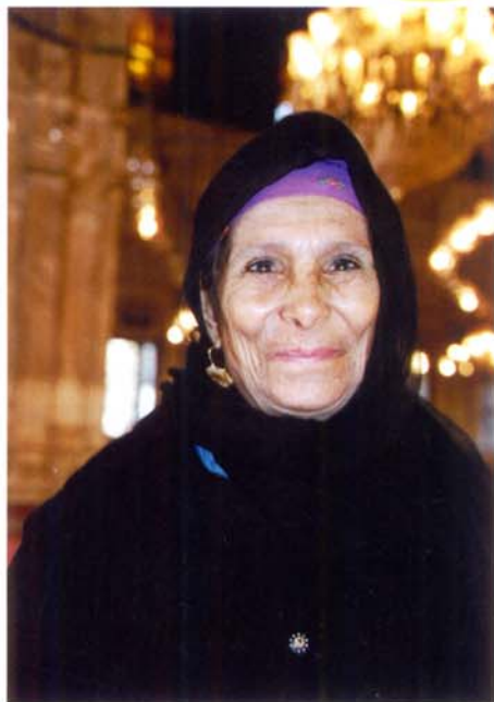
エジプト大使館フアラオニックホール 天野恵利写真展「素晴らしいエジプトと中東の人々」