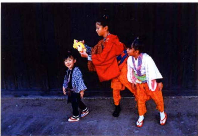
オリンパスギャラリー東京 山川常男写真展「ある晴れた日に」